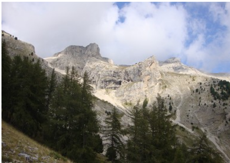
vue du pic de Bure depuis le plan d'eau...